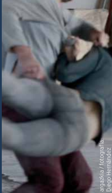
argazkia / fotografía: Diego Hernández